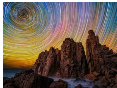
by Lincoln Harrison