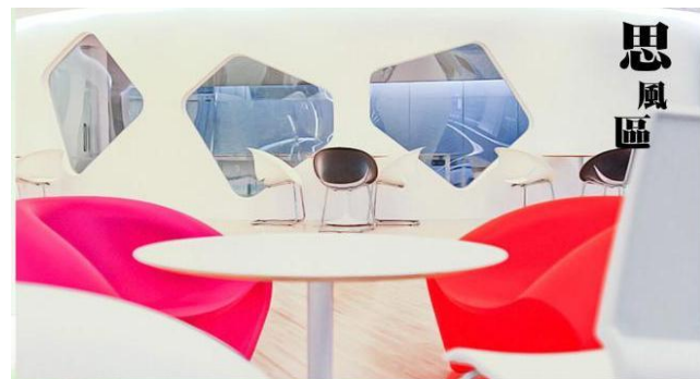
思想就像風，只停駐在有心的人的腦袋中