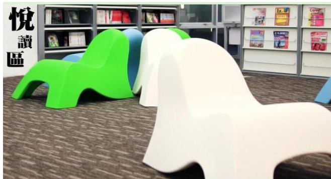
全館最新的書都在這裡