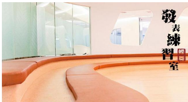
Practice makes perfect.