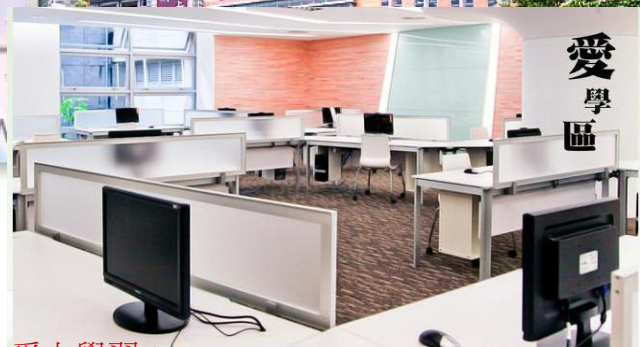
愛上學習： 平面設計軟體、影像剪輯軟體、語言學習