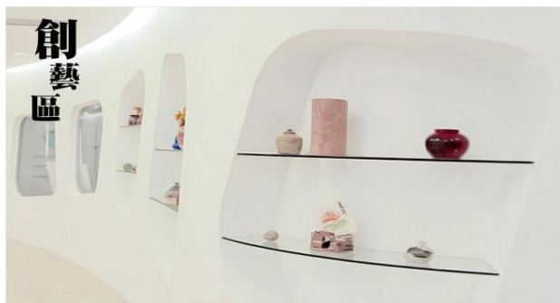
展示你創意的成果