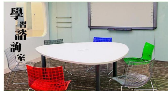
三人行必有我師，等你來諮詢小老師